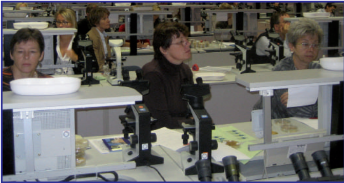
BEGEHRTES FORTBILDUNGS-HIGHLIGHT – DER MIKROSKOPIERKURS