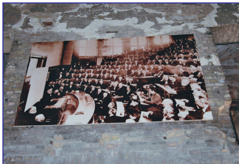
EIN FOTO DES HÖRSAALS VOR SEINER ZERSTÖRUNG IM 2. WELTKRIEG HÄNGT IN DER HEUTIGEN „RUINE“.