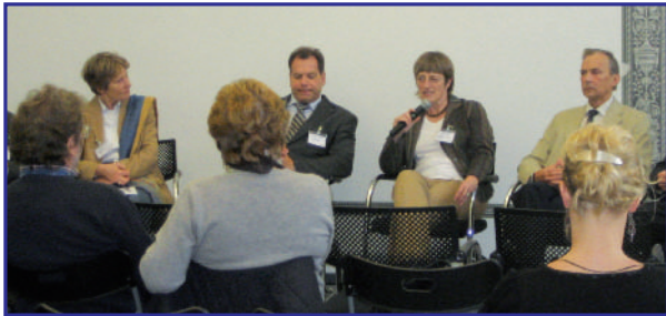
ERSTMALS FAND IM RAHMEN DER MYK' EIN PATIENTENFORUM STATT.