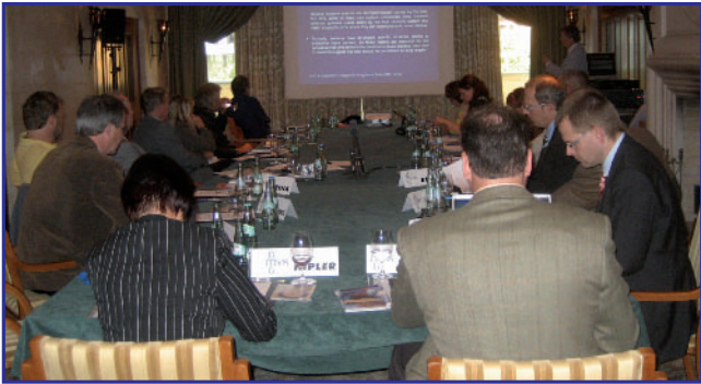
AUFTAKT DER TAGUNG – DIE PRESSEKONFERENZ