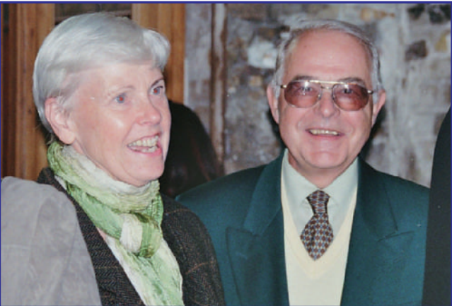
... UND SORGT FÜR STRAHLENDE GESICHTER.