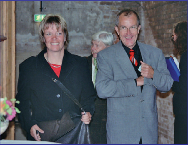
DIE ERSTEN GÄSTE TREFFEN EIN. DIE „RUINE“ LÖST ERSTAUNEN AUS...