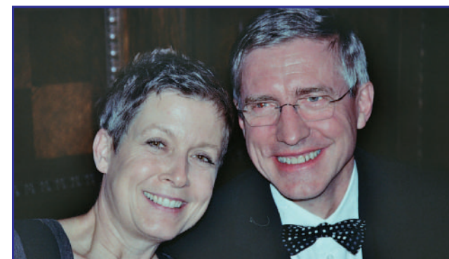
DAS PAAR DER MYK' 2007