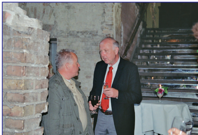
BEGRÜSSUNGEN UND BEGEGNUNGEN