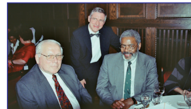
Ein schöner Abend