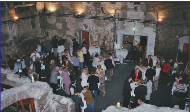
BEGRÜSSUNGSABEND IN DER HÖRSAALRUINE DER CHARITÉ CAMPUS MITTE – EIN DENKWÜRDIGER ORT MIT AUSSERGEWÖHNLICHER ATMOSPHÄRE. DAS BENACHBARTHE MEDIZINHISTORISCHE MUSEUM STAND DEN GÄSTEN AN DIESEM ABEND EBENFALLS OFFEN.