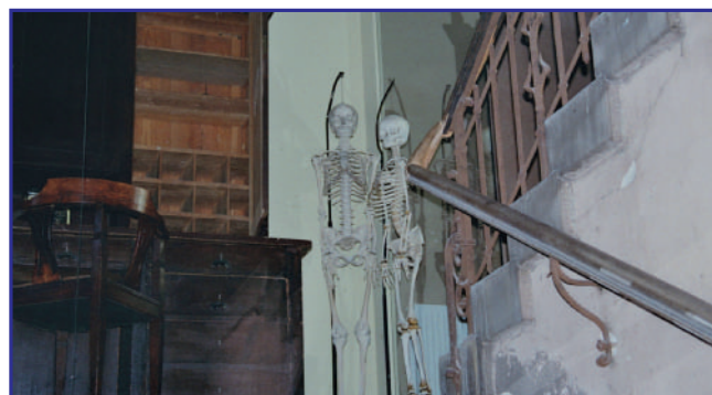
EXPONATE DES MEDIZINHISTORISCHEN MUSEUMS BERLIN