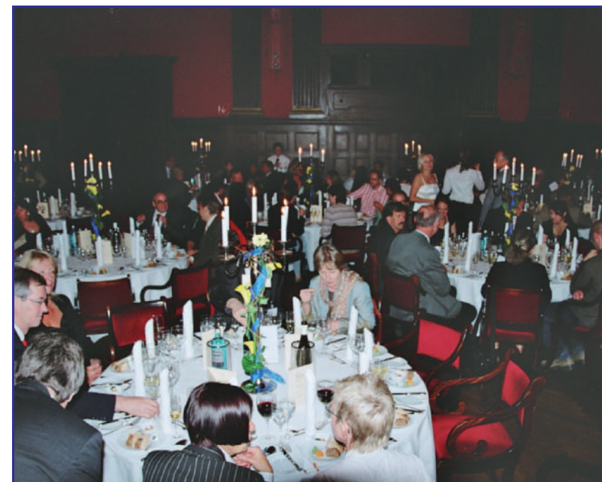
GESELLSCHAFTSABEND IM FESTLICHEN RAHMEN DES HISTORISCHEN MEISTERSAALS IN DER NÄHE DES POTSDAMER PLATZES.