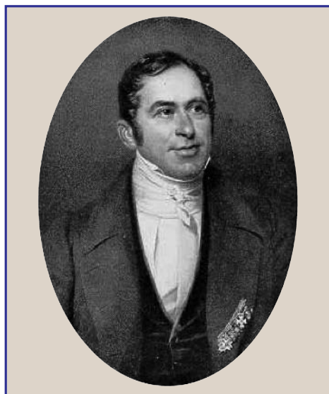
JOHANN LUCAS SCHÖNLEIN 1793–1864