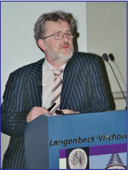
PROF. PETER DONNELLY, NIJMEGEN, NL, HIELT EINE SPECIAL LECTURE ZUM THEMA „TOWARDS A EUROPEAN STANDARD FOR ASPERGILLUS PCR AND UPDATE ON INTERNATIONAL GUIDELINES FOR DIAGNOSIS OF INVASIVE FUNGAL INFECTIONS“.