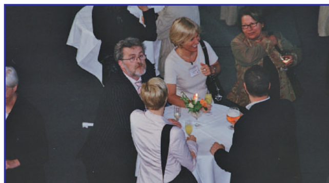
SMALLTALK IN DER „RUINE“