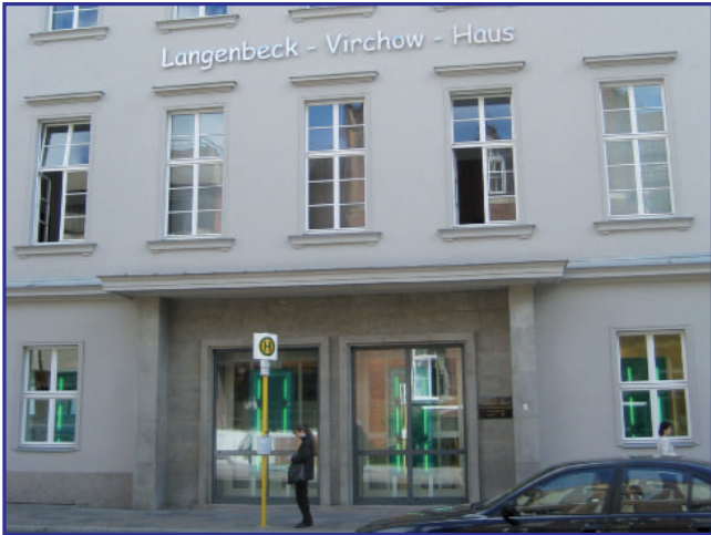
DAS LANGENBECK-VIRCHOW-HAUS IN DER LUISENSTRASSE IN BERLIN, UNWEIT DER CHARITÉ WAR TAGUNGSTORT DER MYK'.